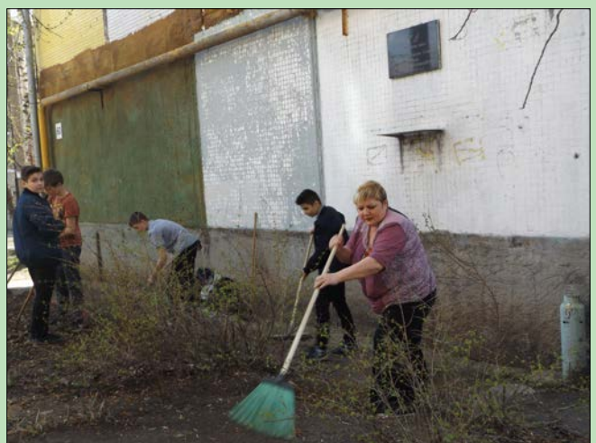
Уборка около мемориальной доски. Школа № 157