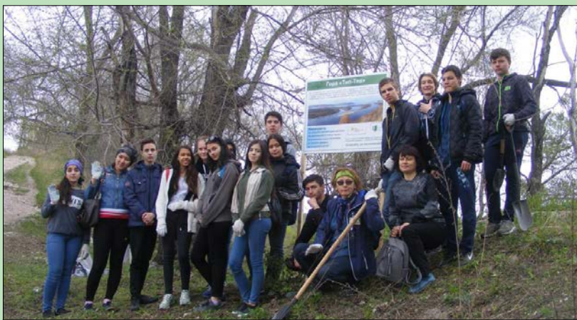
Ребята установили аншлаги, рассказывающие о горе

Акция проводилась в рамках проекта «Сохраним уникальный природный объект «Гора Тип-Тяв», победителя конкурса грантов Президента Российской Федерации на развитие гражданского общества.