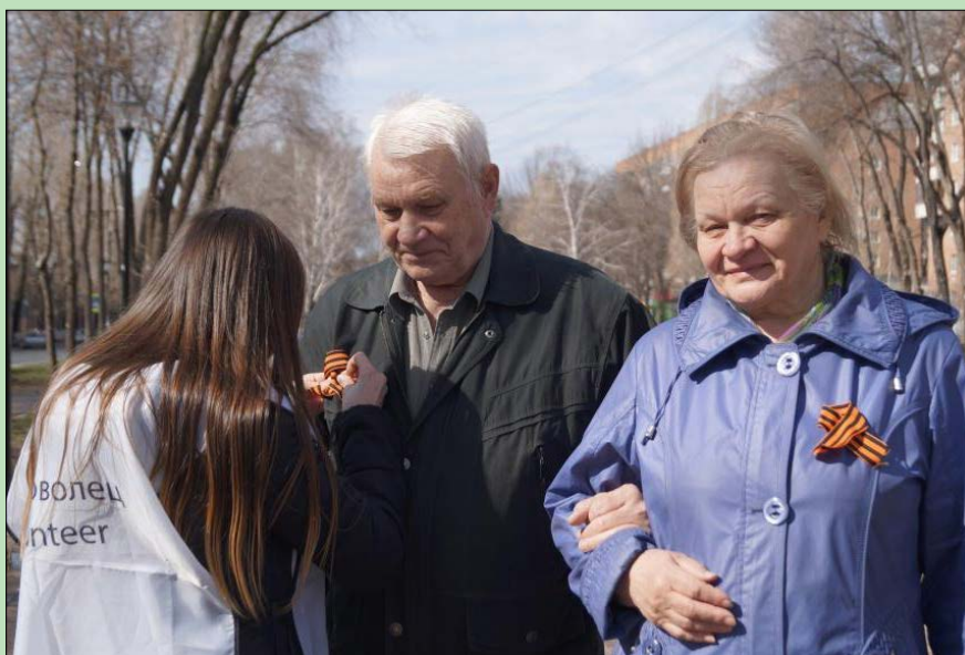
Акция волонтеров Городской лиги на Аллее Трудовой Славы

В результате акции раздали более 220 ленточек.