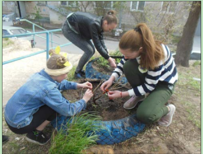
Сирень от волонтеров «Бригантины»

• Волонтеры лица «Классический» провели патриотическое мероприятие «Вахта памяти» около памятной доски герою Ф. С. Бойцову.