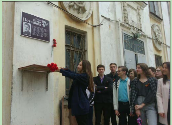
Лицейсты СМАЛ возложили цветы