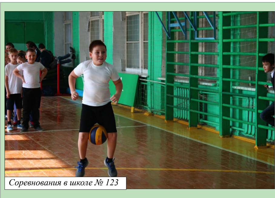
Соревнования в школе № 123

• В п/к «Бригантина» центра «Металлург» волонтеры пригласили ребят из 3 классов. Для них была подготовлена игровая программа по станциям «Нам есть, чем заняться вместо никотина!». Ведущие мышка и кот сопровождали ребят на зажигательном флешмобе, помогали изготовить веселые яркие открытки и, конечно же, пели песни о здоровом образе жизни!