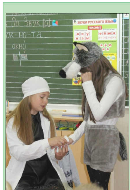
Дети любят сказки

● 19 сентября волонтеры провели необычные уроки для учащихся школы № 145.