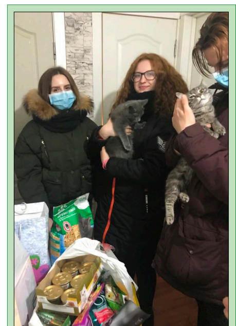
Волонтеры также помогают зооприюту «Кошечка. Кот» и собирают животным корм

В этот же день юные экологи при поддержке ООО «Экострой-ресурс» Самара отправились на озеро неподалеку от ТЦ «Амбар». Берега его оказались настолько плотно замусорены, что волонтерам потребовалось больше четырех часов и три машины, чтобы вывести все собранные отходы с берегов. Несмотря на непростую погоду, Всемирный день чистоты смог состояться!