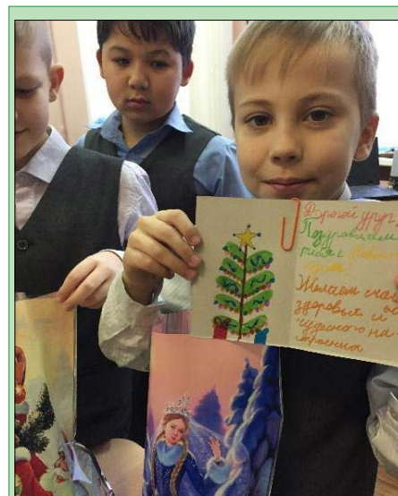
Ребята школы № 70 сами делали открытки в подарок