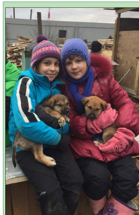
Ученики гимназии № 3 помогли приюту «Участие»