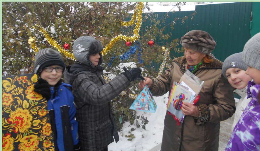
Волонтеры школы № 65 не только преподнесли подарки, но и расчистили дорожки от снега к дому ветерана