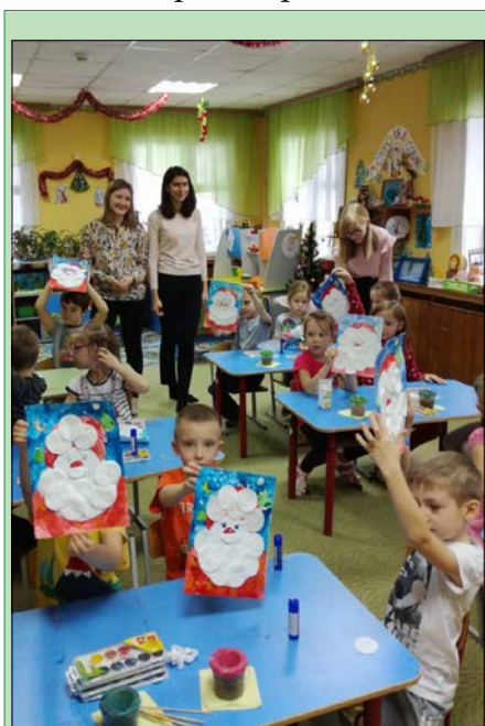
Акция «Малышок» от волонтеров школы № 149

акции волонтеры передали членам кружок творчества для детей, страдающих эпилепсией, созданный в рамках Всероссийского проекта «Не бойся!». Ребята из этого творческого объединения лепят, рисуют, делают своими руками аппликации и поделки.